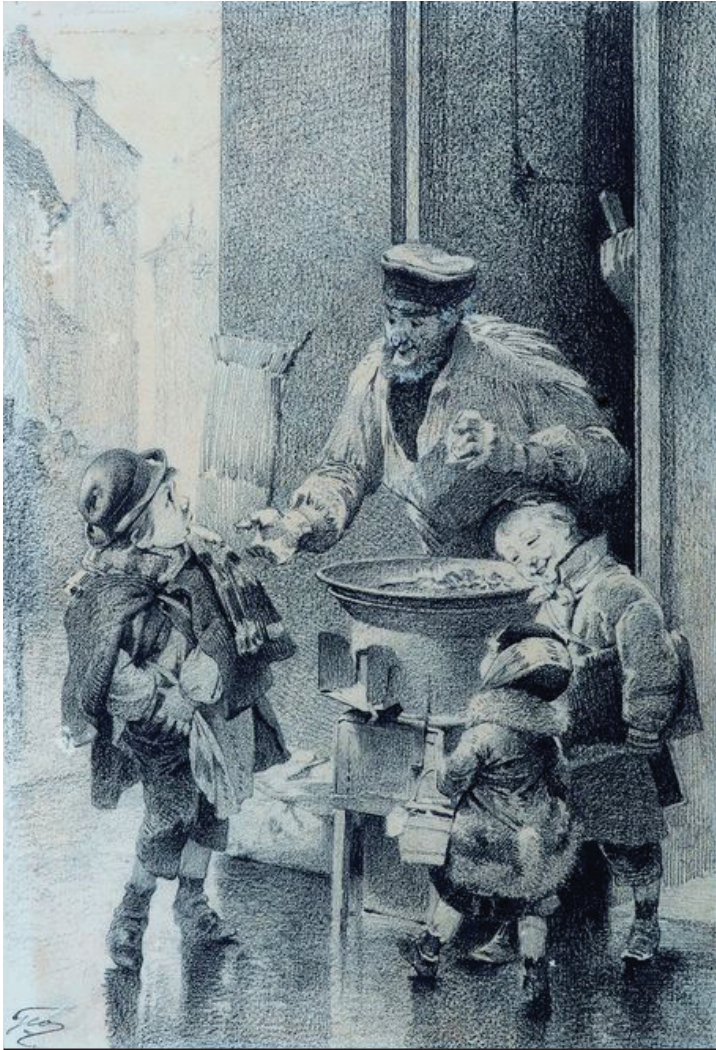
Quart d'heure Rabelais

Observe ce tableau. A ton avis, que cherche ce petit garçon dans sa poche ? Ecris ou dessine ta réponse.