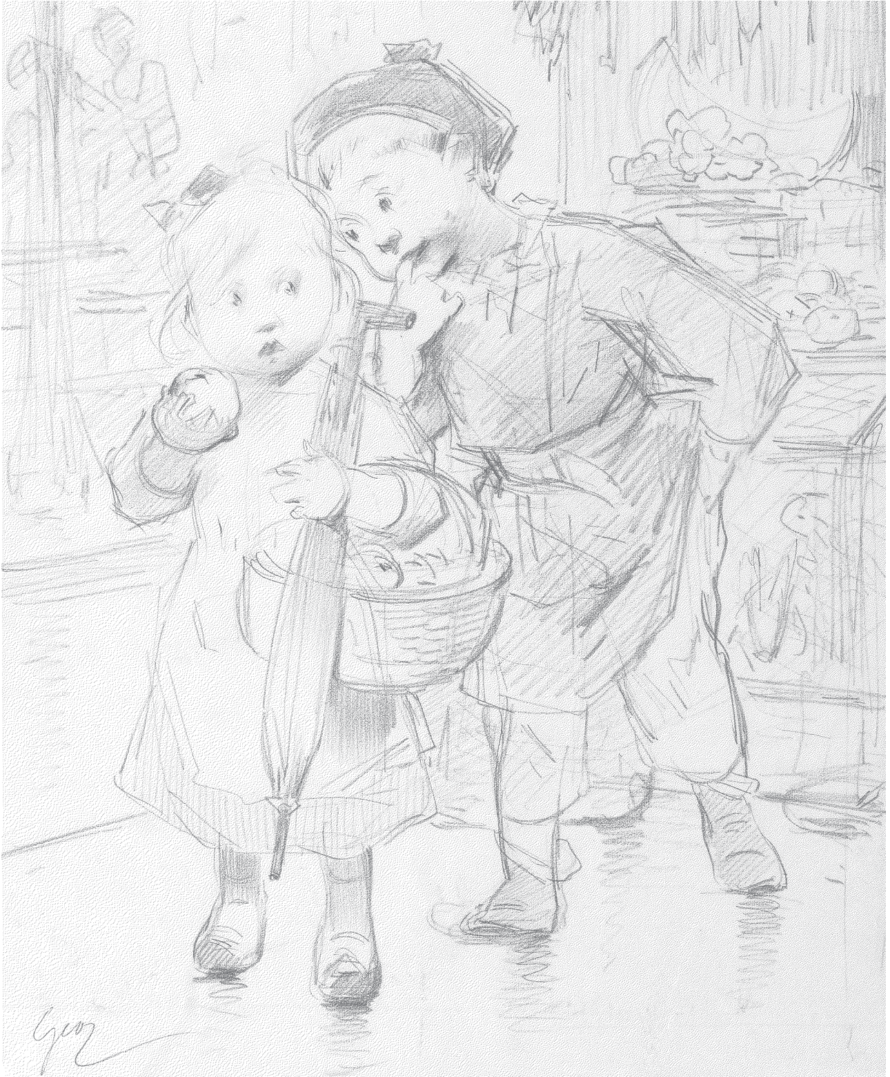
Enfants au marché

Colorie comme tu le souhaites le dessin ci-dessous.