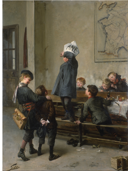
Un futur savant

Penses-tu que ces deux scènes pourraient se produire dans ton école ? Pourquoi ?