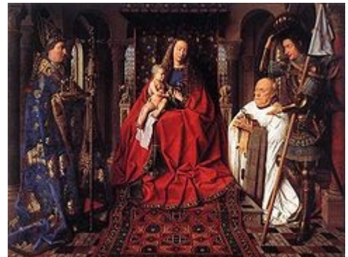
La madone au chanoine van der Paele