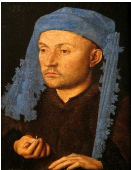
L'homme au chaperon bleu v.1430 dit portrait d'un orfèvre