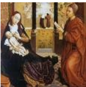
St-Luc dessinant la vierge, v. 1435-1440 Rogier van der Weyden