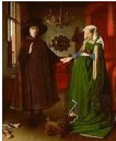
Les époux Arnolfini 1434