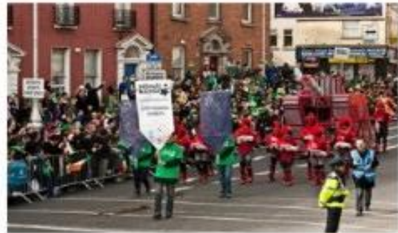
The parade in Dublin