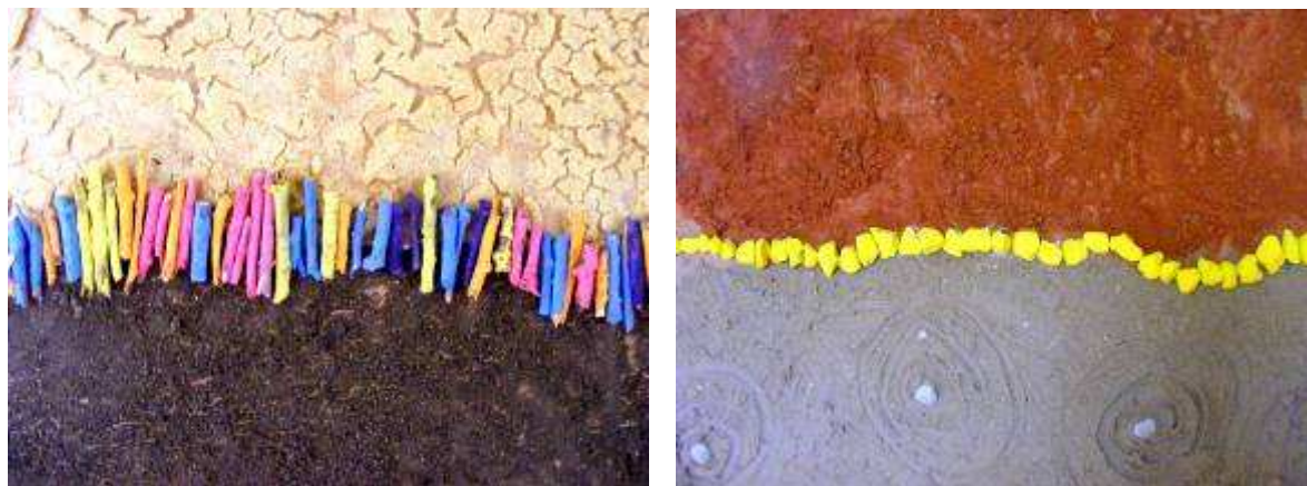
Tableau collectif , installer et coller les éléments mélangés à de la peinture.

Peinture sur très grand format : prendre en photo un élément en noir et blanc ou un détail de la boîte (macro zoom), en faire un grand tirage. Sur un format équivalent (minimum 1m X 1m), l'élève doit reproduire ce qu'il voit avec de la gouache en nuances de gris.