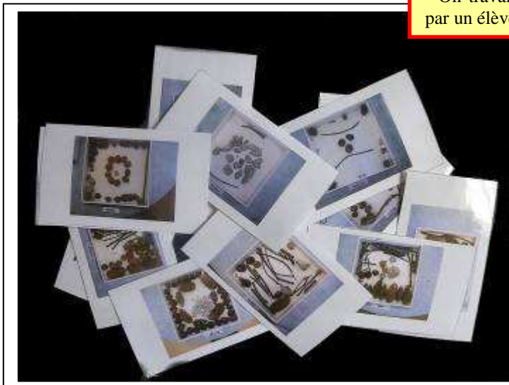
Cartes du loto