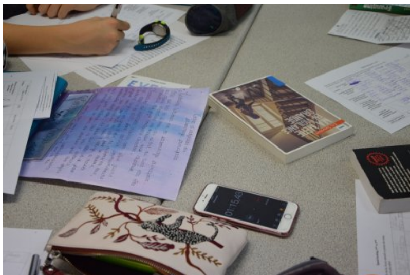
Speed-booking avec travaux et chrono.

Cette activité est dérivée du principe du speed-dating. Il s'agit de partager le plaisir de lire. Chaque participant doit présenter à d'autres personnes, dans un temps très limité (3 min.), un livre qu'il a lu, et les convaincre de le lire. Elle peut être organisée au sein d'une même classe, entre plusieurs classes d'un même niveau ou de niveaux différents. Nous l'expérimentons au lycée depuis 2 ans dans le cadre de la liaison 3ème-2nde avec des collèges du réseau.