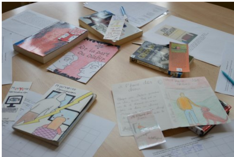
Quelques travaux d'élèves : marques-page, nouvelles couvertures...

Chacun doit en parallèle de sa lecture réaliser deux activités, une obligatoire et une au choix parmi celles proposées. La création d'un marque-page « publicitaire » est obligatoire. Il doit proposer une brève présentation de l'histoire, une illustration, un slogan, un logo, une citation, un extrait... Il sera présenté lors de l'oral et consiste à « vendre » le livre. A la main ou à l'ordinateur, il permet aux élèves de laisser s'exprimer leur créativité. La deuxième activité est à choisir parmi une liste validée par les enseignants en amont (à adapter au niveau des élèves ou à vos envies).