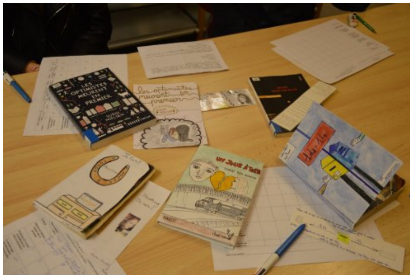
Séance de speed-booking 3ème-2nde