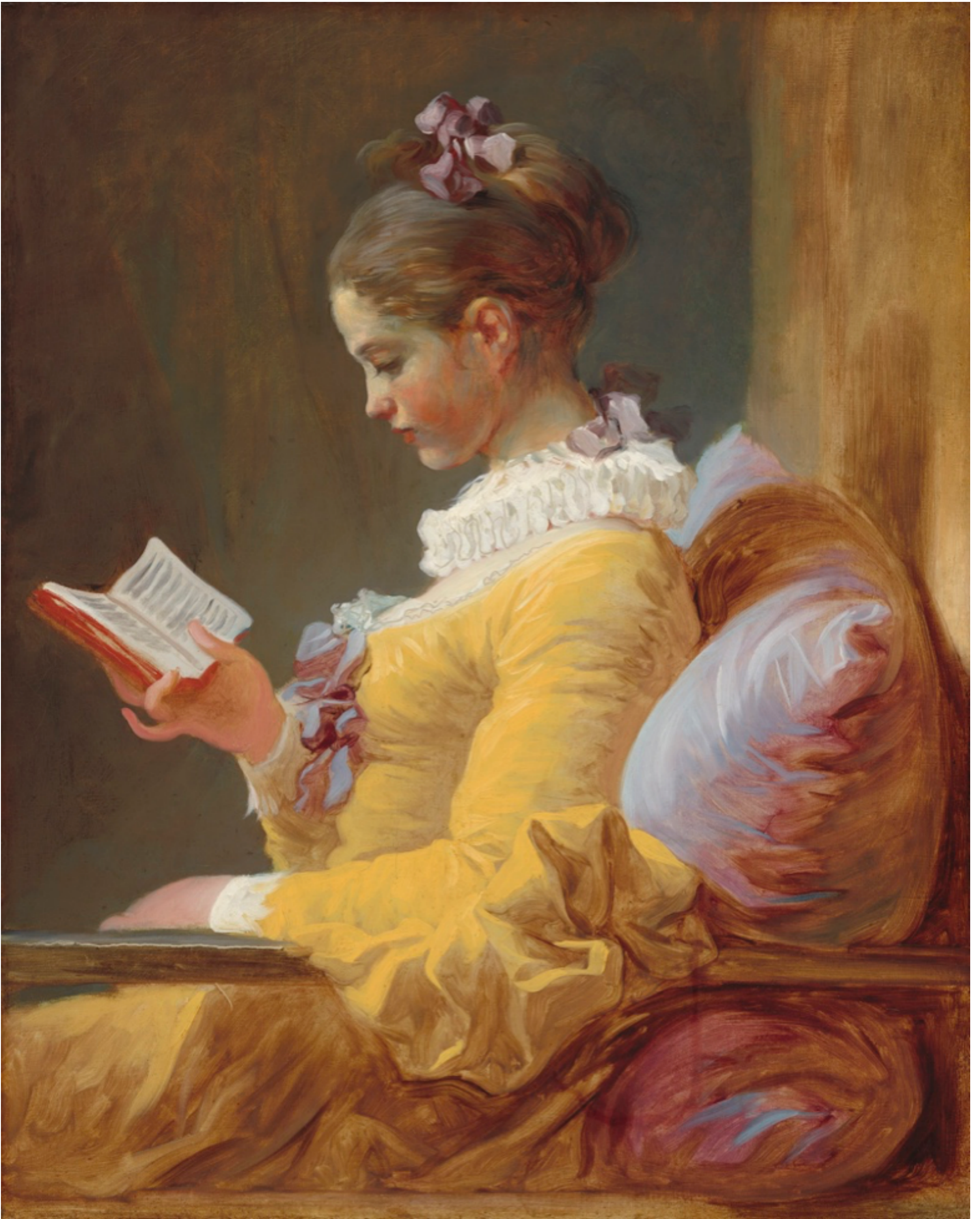
La Liseuse , vers 1769, Jean Honoré Fragonard, National Gallery of Art, Washington