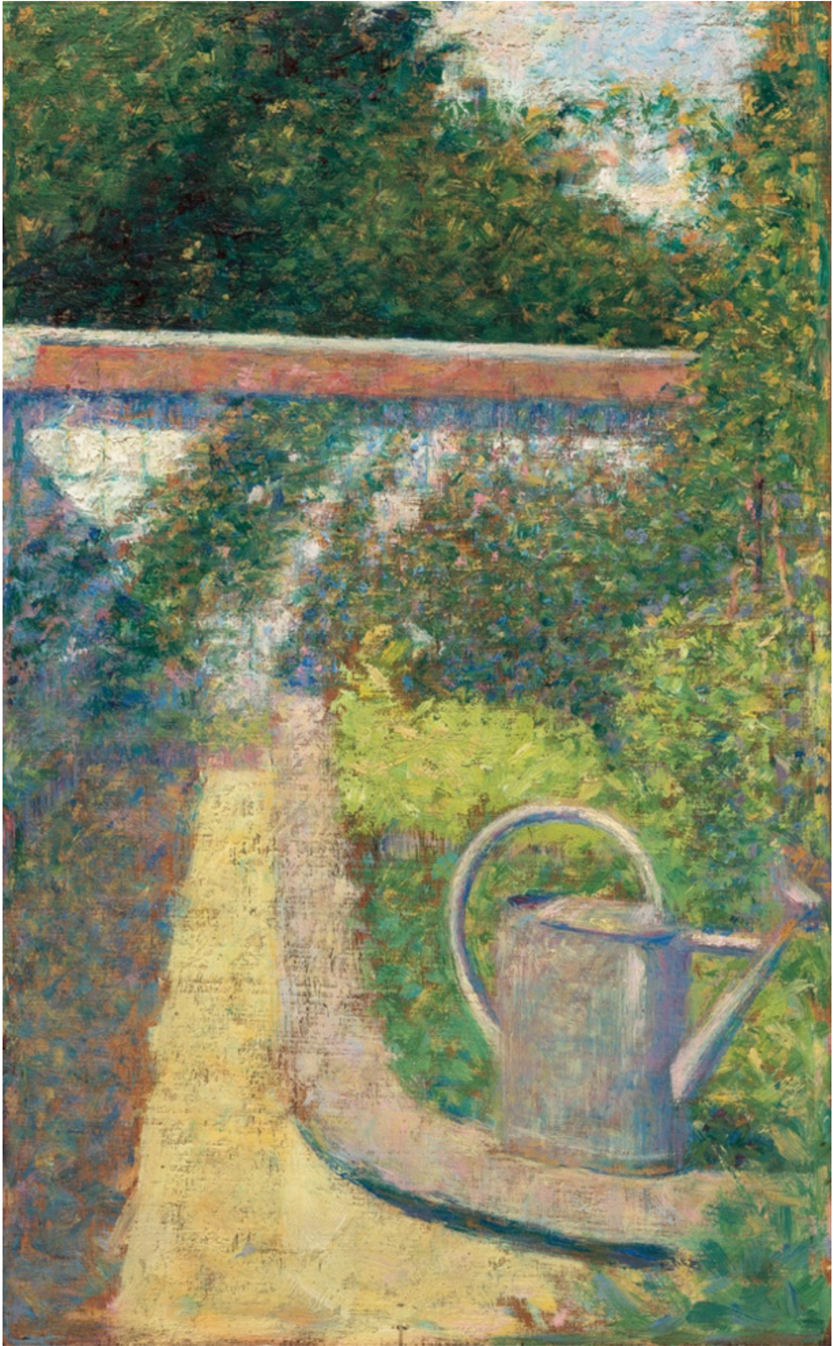
L'arrosoir , vers 1883, Georges Seurat, National Gallery of Art, Washington