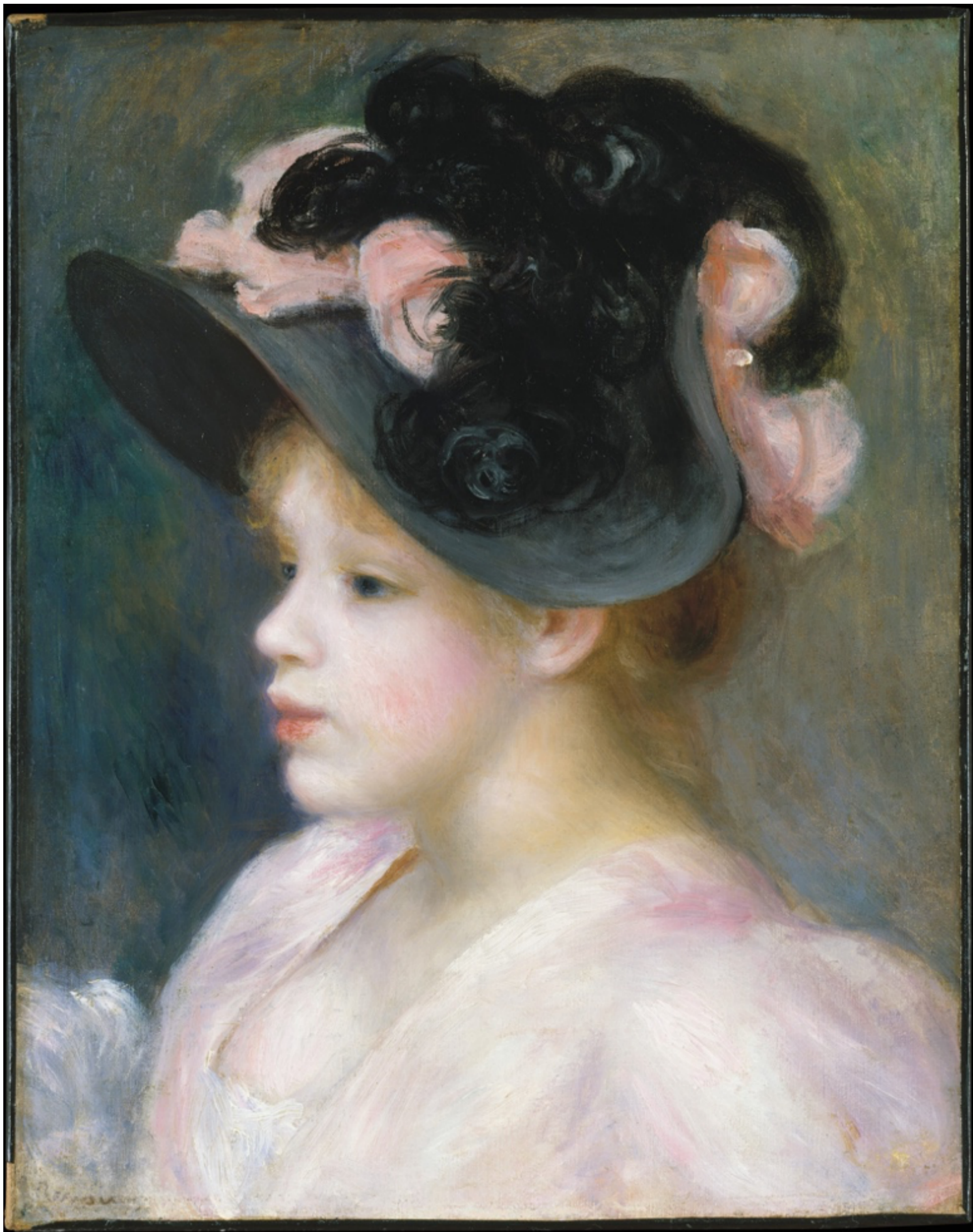
Jeune fille au chapeau rose et noir , vers 1891, Auguste Renoir, The Metropolitan Museum of Art, New York