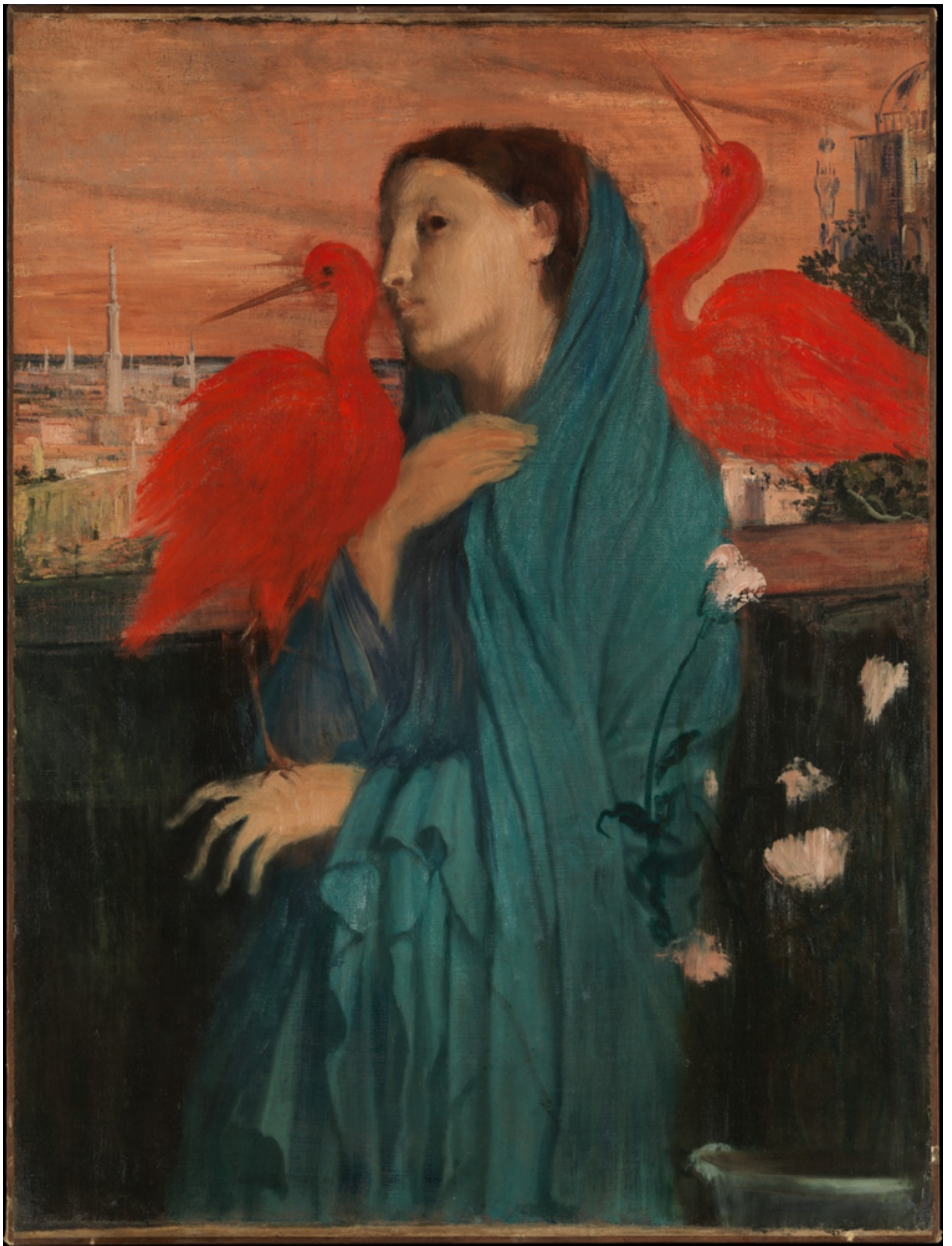
Jeune fille aux ibis , vers 1860-62, Edgar Degas, The Metropolitan Museum of Art, New York