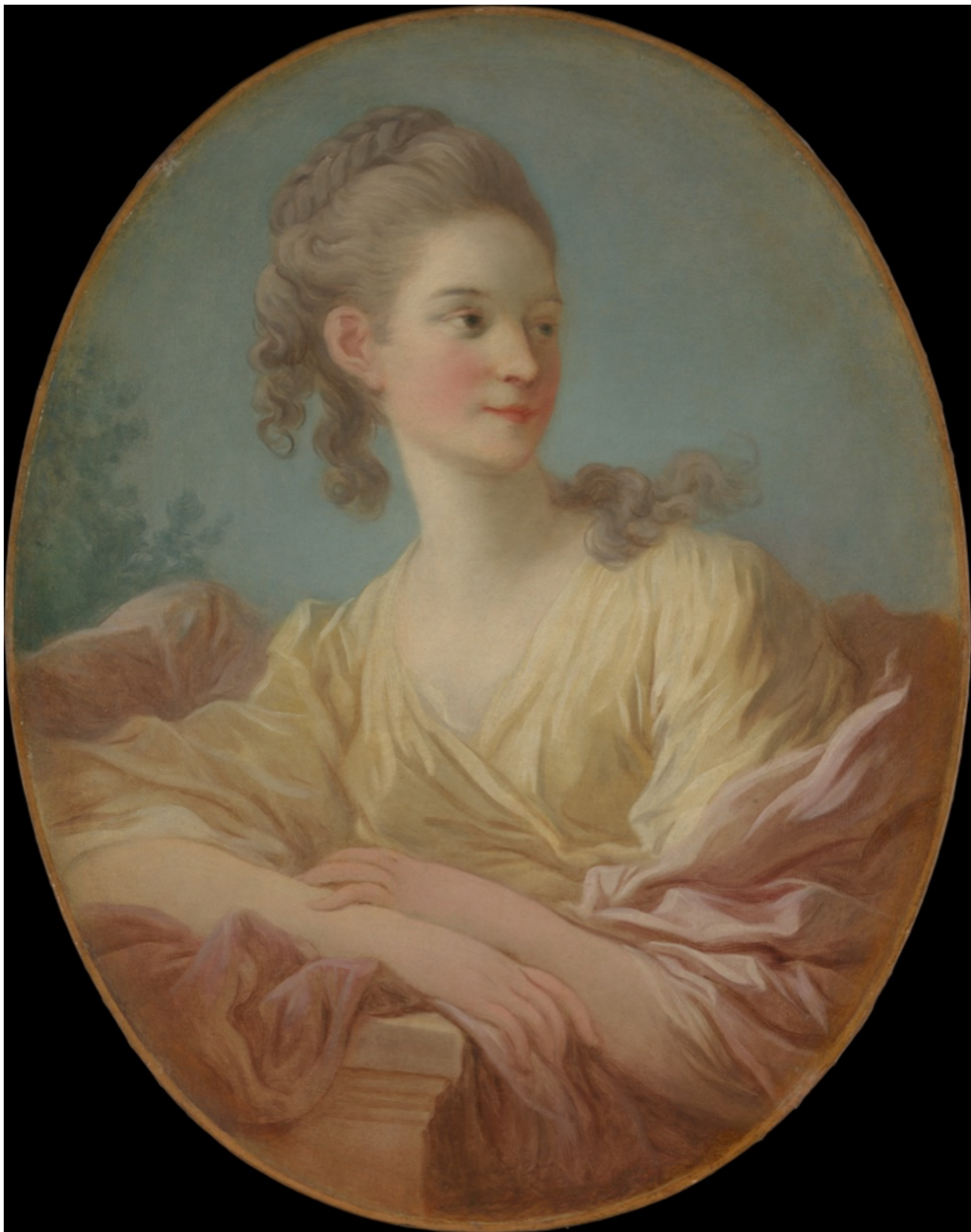
Portrait d'une jeune fille , vers 1770, Jean Honoré Fragonard, The Metropolitan Museum of Art, New York