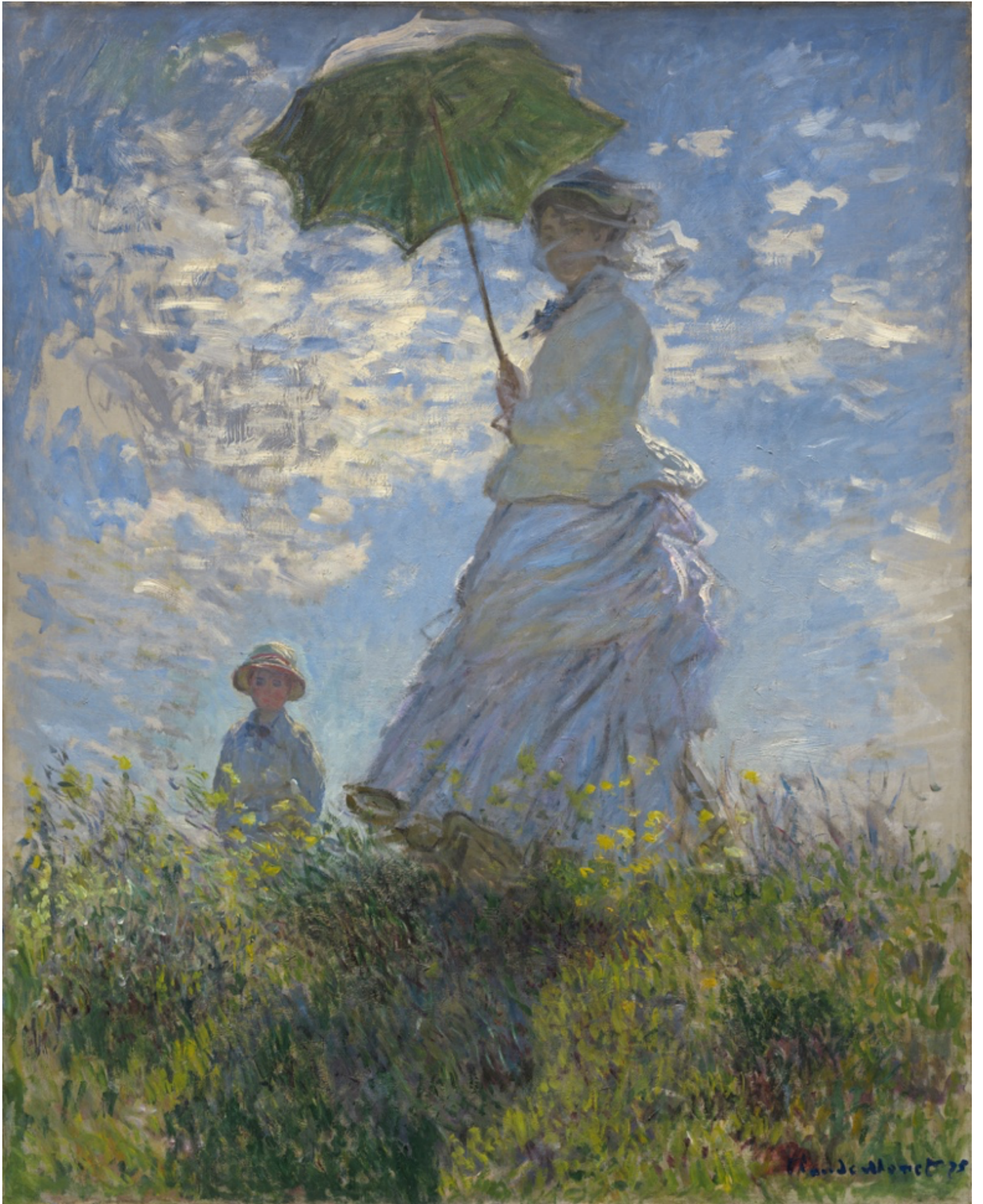
Femme au parasol - Madame Monet et son fils , 1875, Claude Monet, The National Gallery of Art, Washington