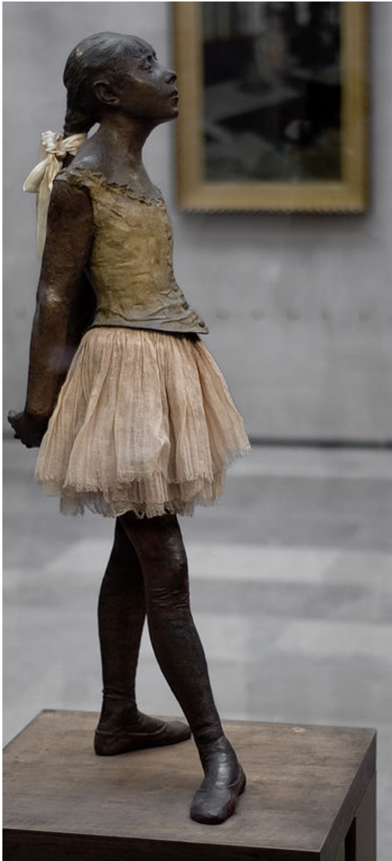
La Petite Danseuse de quatorze ans , 1881, Edgar Degas, Musée d'Orsay, Paris