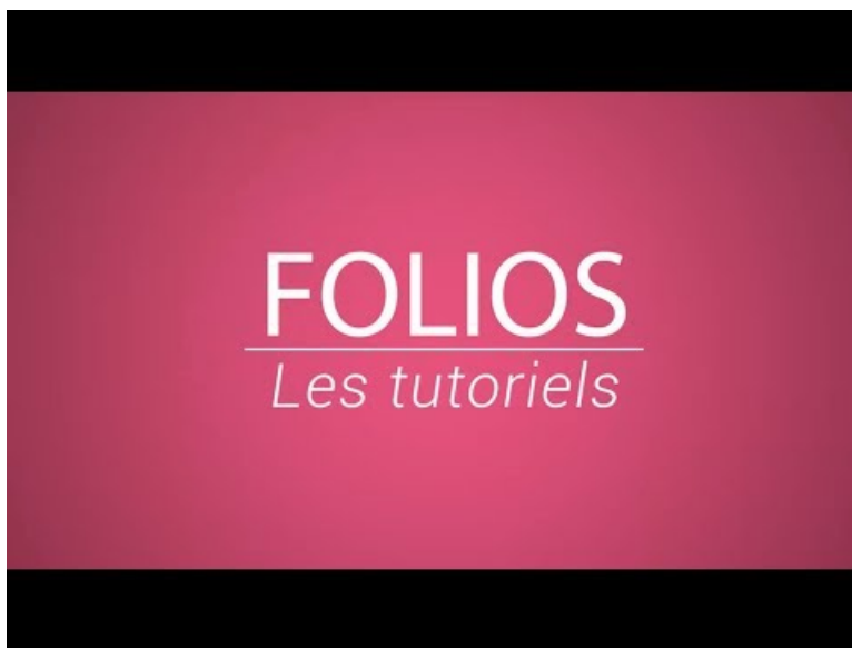
Activation des classes et des groupes ( Video Youtube )

Les établissements doivent penser à activer leurs classes et groupes dans la console d'administration. Tutoriel vidéo :