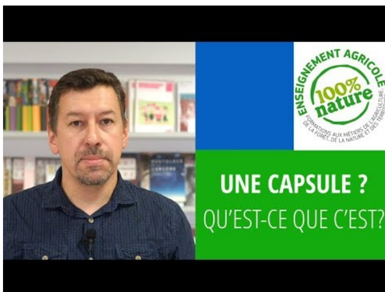
Une capsule vidéo, c'est quoi ? (Video Youtube)

Elle met en avant une collection de 6 tutoriels co-produits par Canopé et la DRAAF Hauts-de-France diffusée sur le site Youtube : qu'est-ce qu'une capsule, quels outils, comment scénariser, votre prise de parole dans une capsule, le montage, la diffusion.