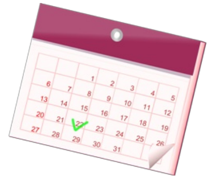
Image calendrier Cco