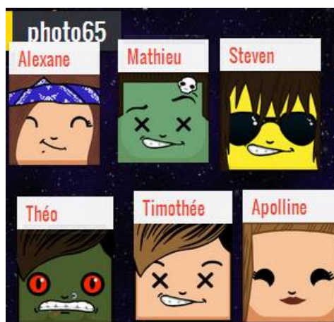
Exemple de mur collaboratif sur l'identité numérique

Padlet apporte une solution agréable à utiliser pour faire créer en groupe un document commun multimédia (intégrant si nécessaire des images fixes ou animées, des fichiers audio...). Certains enseignants créent un mur virtuel sur lequel les élèves peuvent ajouter leurs "post-it" sans pouvoir modifier le contenu déjà affiché, et intègrent dans ce document des liens vers d'autres "murs pour élèves" gérés avec un paramétrage différents. Ces "murs pour élèves" peuvent être plus collaboratifs (interactions possibles sur les post-it, le professeur ou un élève pouvant être modérateur des posts pour le groupe), et ne nécessitent pas la création d'un compte pour les contributeurs.