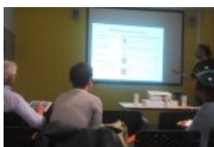
atelier "collaboration entre profs" rencontres autour du numérique 2014

Deux enseignants ont apporté leur témoignage lors des " Rencontres autour du numérique " du 9 avril 2014.