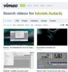
Exemple de recherche de tutoriel pour Audacity sur Vimeo (site de partage de vidéos)