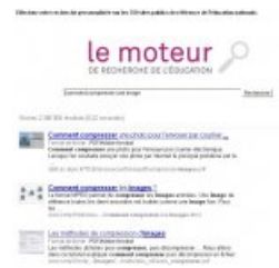
Exemple de requête "par question" sur le moteur de recherche de l'Education.

Voir ci-dessous la présentation utilisée le 9 avril par le témoin.