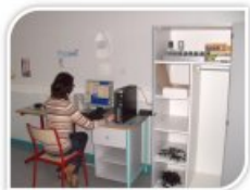
Espace langues vivantes du lycée

le témoignage du lycée du Haut Val de Sèvres à St Maixent