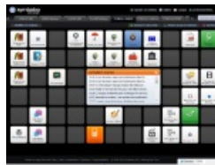
Ressources et applications mises à disposition des élèves de terminale par les professeurs de lettres-histoire

► Les élèves s'emparent-ils de ces outils ?