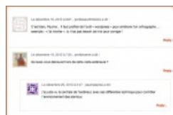
Commentaires d'enseignants sur un portfolio

Au fil des années, les auteurs en herbe prennent confiance, les écrits s'accroissent et s'améliorent.