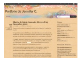
2012 : L'élève a effectué plusieurs périodes en entreprise et amélioré son niveau de rédaction.

Au fil des années, les auteurs en herbe prennent confiance, les écrits s'accroissent et s'améliorent.