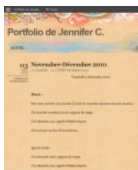
2010 : L'élève effectue sa 1ère période en entreprise et rédige ses 1ers billets sur le portfolio.

Ces commentaires encouragent et accompagnent l'élève, posant parfois des questions, par exemple pour inciter à étoffer ou clarifier un propos.