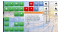
Le bureau virtuel Symbaloo d'un autre professeur de lettres histoire

Beaucoup de jeunes savent utiliser des outils du web notamment pour partager des applications et des documents qui les amusent. Je voudrais les inciter à utiliser des outils similaires pour se former et s'informer.