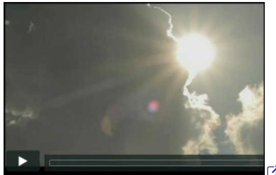
La bande annonce