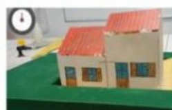
Structures sous pression