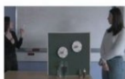
Çà pousse, çà pousse !!!!!