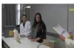
Attention, je range !