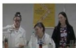
Ne buvez pas de produit chimique !