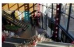
L'effet Meissner à Mandala