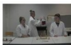
Ne jetez pas les produits chimiques n'importe où !