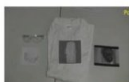
Comment manipuler en toute sécurité lors des TP de chimie ?