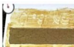
Bâtiments, des colosses aux pieds d'angle

► Retrouvez tous les films de l'édition 2020