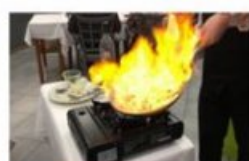
De la chimie en cuisine