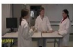
Accès labo interdit !