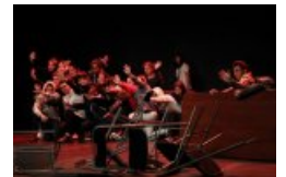
"Why ?" Collectif OS'O

Les spectacles programmés en séances scolaires sont choisis pour susciter le débat avec et entre les jeunes sur des questions de société . Quelles limites rencontre-t-on en famille, entre amis, dans la société ? Comment faisons-nous société aujourd'hui ? Quelle est aujourd'hui la réalité désignée par l'expression "classes sociales" ? Comment (sur)vit-on en période de crise économique ? Qu'est-ce que la politique et à quoi sert-elle ? Qu'est-ce que le respect de soi, d'autrui, d'une culture, de convictions ?