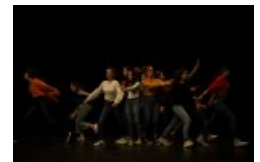
“Le Vent en poulpe” (2020)

les rencontres théâtrales lycéennes du festival “ Le Vent en poulpe ” font par exemple partie de ces dispositifs.