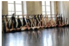
Masterclasse danse - Cie El Nucleo

Une dizaine de dispositifs constitue l'offre des 3T en éducation artistique et culturelle sur le temps scolaire . De nombreux projets spécifiques sont également créés au cas par cas, selon les demandes des enseignant.e.s et les besoins de leurs élèves.