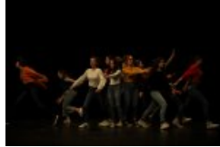
"Le Vent en poulpe" (2020)

Depuis 2013 , la scène des 3T est devenue le principal lieu de diffusion de spectacles vivants dans le Nord du département de la Vienne . Pour la saison 2017-2018, le théâtre s'est vu décerner, par le ministère de la Culture, l'appellation de Scène conventionnée d'intérêt national, "art et création" . Cette appellation conforte environ 113 structures dans leur action en faveur de la création et de la diversité artistiques , de l' éducation artistique et culturelle , du développement de la participation à la vie culturelle dans un territoire donné.