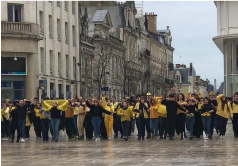
Etudiant.e.s et lycéen.ne.s, 6/04/2019 à Poitiers - "Résistance(s)", Claire Servant