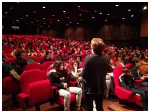
Rencontre entre l'auteur et le public des collégiens.

Les élèves des 6 collèges de Charente et Charente Maritime découvrent 3 œuvres, d'autres pays européens, d'autres cultures. Ils rencontrent les trois auteur.e.s le jour de la remise du prix, mi-novembre. Cette action permet de développer le goût de la lecture et l'expression artistique, de pratiquer l'expression écrite et orale (prise de parole, échanges argumentés). Tout au long de l'action, les élèves acquièrent des méthodes de lecture, des techniques de compte rendu (écrit et oral), des connaissances littéraires et culturelles sur d'autres pays d'Europe.