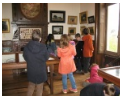
Visite du musée

Les publics scolaires, de la maternelle au lycée, sont accueillis toute l'année et peuvent bénéficier d'une visite guidée . Le service des publics met à disposition documents et outils pédagogiques pour la visite des collections permanentes (collections faïence, beaux-arts, mobilier, moyens de transport).