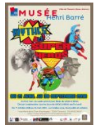
Expo 2018-2019 ↗