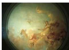
F. Besson - © Musée Henri Barré

Entièrement renové en 1993 , le musée a néanmoins conservé le charme inhérent aux maisons de collectionneurs du XIXe siècle.