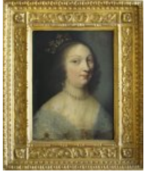
Marie de la Tour d'Auvergne ↗

Au rez-de-chaussée, une salle est consacrée à l' histoire du protestantisme dans la région ainsi qu'à la famille des La Trémoille, plus particulièrement à Marie de la Tour d'Auvergne , duchesse de la Trémoille (1601-1665). Malgré la conversion de son mari au catholicisme, en 1628, elle reste fidèle à la religion réformée et assume le rôle de protectrice des communautés huguenotes du Poitou et de haute Bretagne. Le château des ducs de la Trémoille, principal monument de la ville de Thouars, est construit sous son initiative. Elle y vécut et y est inhumée.