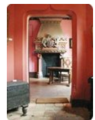
Vestibule et cabinet de travail ↗