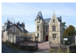
Musée Henri Barré

La façade néogothique de l'hôtel particulier, construit en 1862 , suit les plans dessinés par Henri Barré . L' esthétique médiévale se prolonge dans le vestibule octogonal et le cabinet de travail, tandis que l'ameublement cossu du salon et de la salle à manger répondent aux goûts du Second Empire . Le plafond circulaire du salon, décoré dans l'esprit du XVIIIe siècle, est une œuvre du peintre Faustin Besson , ami d'Henri Barré, venu à Thouars vers 1870 pour superviser l'aménagement.