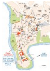
Musée Henri Barré