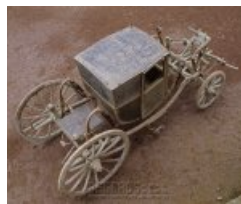
Coupé hippomobile ↗

L'ancienne conciergerie abrite enfin une demi-berline de style Louis XVI (dépliant - PDF de 8.89 Mo), vraisemblablement commandée vers 1770 par Philippe Antoine de Liniers, issu de l'une des plus vieilles familles nobles du Poitou. Ce carrosse figure parmi les plus anciens véhicules hippomobiles français et se distingue par son excellent état de conservation.