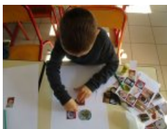
Atelier - Musée H.B.