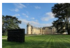
Le parc

En juillet 2005, une nouvelle phase de développement artistique est lancée : le ministère de la Culture concrétise le projet de création d'un parc contemporain , dont la mise en oeuvre, accompagnée de nouvelles commandes publiques, est effectuée entre 2005 et 2008.