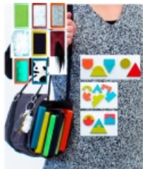
Outils multi-sensoriels ↗

Conformément aux missions qui lui sont confiées par le Centre des monuments nationaux, le château d'Oiron propose au grand public des visites du monument et de la collection permanente , il organise en moyenne trois expositions temporaires d'art contemporain chaque année, invite des artistes en résidence et organise des conférences (voir la rubrique actualités ↗ du site internet du château). Par ces actions de médiation, le château d'Oiron s'emploie à susciter l'émerveillement, la réflexion et le questionnement, à favoriser le dialogue entre artistes et publics, entre oeuvres d'art et société . Il s'agit de faciliter l'accès à l'art contemporain comme forme particulière d' interprétation du monde , de même que le "cabinet de curiosités" invitait jadis à mieux connaître le monde pour mieux le comprendre.