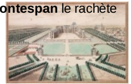
Le château d'Oiron (1709)

l'endettement du dernier seigneur d'Oiron le contraint à céder le château à son créancier. Madame de Montespan le rachète en 1700, quelques années avant sa mort à Bourbon-l'Archambault, en 1707.