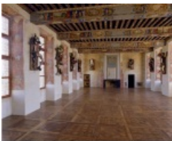
© Daniel Spoerri - 2008 - L'œuvre "Le corps en morceaux" de l'artiste Daniel Spoerri. Collection permanente, Château d'Oiron, France.

En 1989 , le ministère de la Culture et de la Communication décide d'enrichir le patrimoine historique du château d'Oiron d'une collection d'art contemporain, conçue spécifiquement pour le lieu par des artistes internationaux. Intitulé Curios & Mirabilia , en référence aux cabinets de curiosités de la Renaissance et aux prestigieuses collections de Claude Gouffier, cet ensemble est présenté pour la première fois dans sa totalité en 1996 et réunit aujourd'hui des oeuvres de plus de 70 artistes .