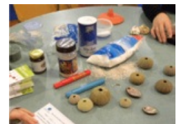
Atelier "Cultures marines"