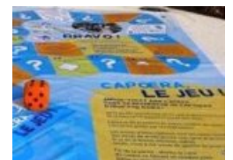
Jeu CapOeRa (APECS) ↗

► Page suivante : éducation à l'environnement et au développement durable pour d'autres publics.