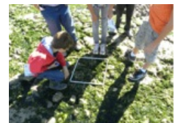
Sortie "Le peuple de l'estran"