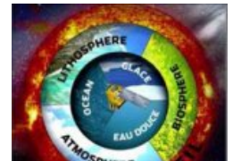
"Depuis l'espace, un autre regard"