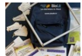
kit pédagogique BioLit

Le Kit pédagogique BioLit (activité réalisée par l'association Planète Mer ) est disponible sous