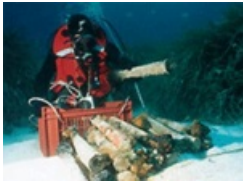
Atelier "Métiers de la mer"

L'E.C.O.L.E. de la Mer dispose de nombreuses ressources facilement transportables, qui peuvent être mises à disposition des établissements scolaires gratuitement sur réservation (expositions, jeux, malles) . La plupart des fiches d'activité associées sont téléchargeables à partir du site internet de l'E.C.O.L.E de la Mer (voir ci-après).