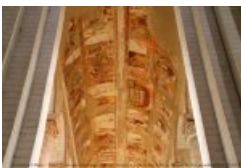
La voûte

La quasi-totalité des parois de la crypte témoigne des péripéties du martyr de saint Savin et saint Cyprien, qui seraient morts à Cerisier (aujourd'hui Saint-Savin) au Ve siècle et auraient trouvé là leur première sépulture chrétienne, avant que les restes de saint Cyprien ne soient transférés à Poitiers quelques siècles plus tard.