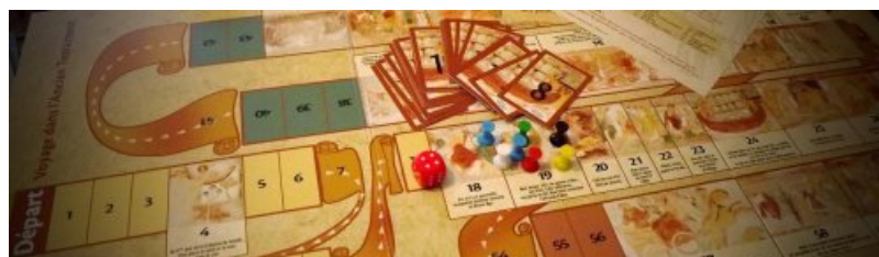
Onglet "Enseignants" du site internet

Destiné aux 34 collèges publics de la Vienne , le dispositif , lancé conjointement par le département de la Vienne et les services départementaux de l'Éducation Nationale, répond à des objectifs tout à la fois culturels, pédagogiques et touristiques, et facilite l'accès à 23 sites patrimoniaux en prenant en charge les frais de déplacement .