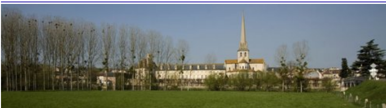
Abbatiale de Saint-Savin-sur-Gartempe