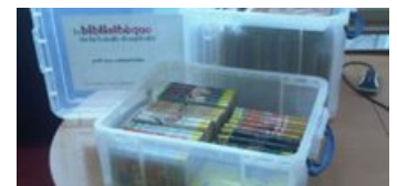
Bibliothèque - Malles pédagogiques ↗

Dans la bibliothèque , située à 2 minutes à pied du musée, un secteur jeunesse est aménagé pour les enfants, avec coussins et tapis confortables. La bibliothèque propose aux groupes un service de prêt de malles pédagogiques ↗ .