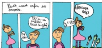
Ateliers de pratique graphique ↗