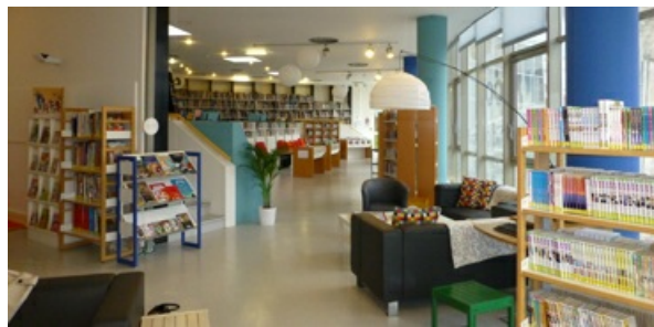
Bibliothèque de la CIBDI ↗