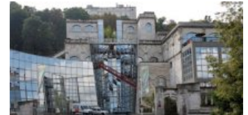
Façade de la bibliothèque - CIBDI

Située dans le " Vaisseau Mœbius ", à deux minutes à pied du musée, elle dispose d'un fonds unique en Europe dans le domaine de la BD, quasi exhaustif sur la production française de 1984 à 2014. Elle comprend une salle de lecture publique , un centre de documentation sur la bande dessinée et un fonds de conservation à but patrimonial. La salle de lecture, ouverte toute l'année, possède un fonds de plus de 46 000 albums adulte et jeunesse consultables sur place ou à emprunter. Elle est accessible à tous gratuitement .