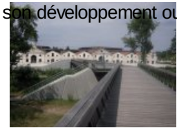
Musée de la BD et passerelle Hugo Pratt ↗

nos jours : depuis son berceau européen et particulièrement franco-belge, en passant par son développement outre-Atlantique et l'influence considérable de la BD américaine dans le monde entier, jusqu'aux différentes étapes du processus de création , allant du scénario à la mise en couleurs. Ce parcours est jalonné de documents rares et de planches des grands maîtres.