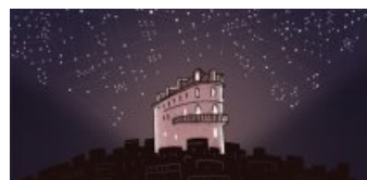
Cité de la BD - Maison des auteurs ↗

► Page suivante : La médiation culturelle à destination des publics scolaires.