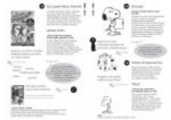
Extrait du livret-jeu pour visite libre ↗