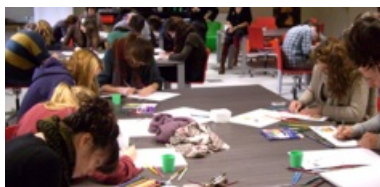
Ateliers de pratique