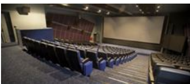
Le cinéma de la cité de la BD ↗

Le Vaisseau Moebius abrite aussi le cinéma, qui s'est imposé comme une nécessité, car images fixes et animées dialoguent de plus en plus. Les images fixes migrent des pages des bandes dessinées vers les salles de cinéma, d'internet aux consoles de jeu, de l'écran de télévision à l'écran du téléphone portable.