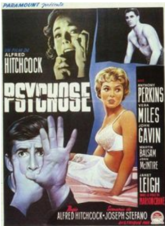
Affiche du film "psychose"