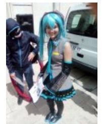
Prix Minami Manga