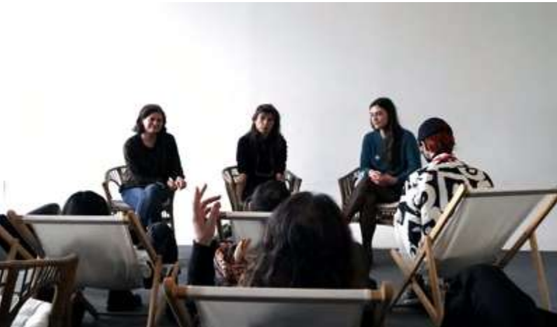
Le Sang de Cinéaste, séance d'écoute 2022

Cette séance d'écoute est proposée par l'association POITCAST en écho à la thématique centrale du festival. Poitcast est une association de création et de transmission sonore. Née en 2021, elle propose des séances d'écoute, des formations, des ateliers de création, et de l'accompagnement personnalisé.