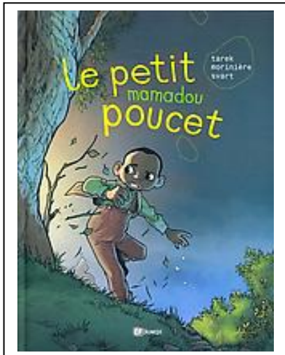
Le petit mamadou poucet

SÉLECTION 2009 PRIX BD DES COLLÉGIENS DU POITOU-CHARENTES