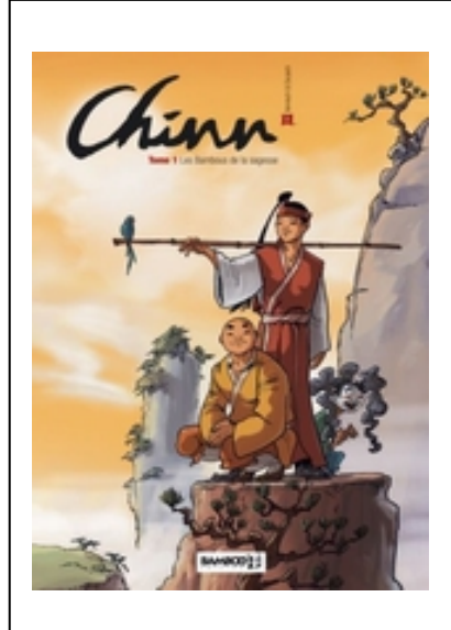
Chim, tome 1: les bambous de la sagesse