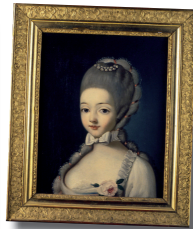
Dame de Richemont

6- Observez et décrivez le portrait de la " Richemonette ". Cette femme paraît-elle réelle ? (Justifiez votre réponse)