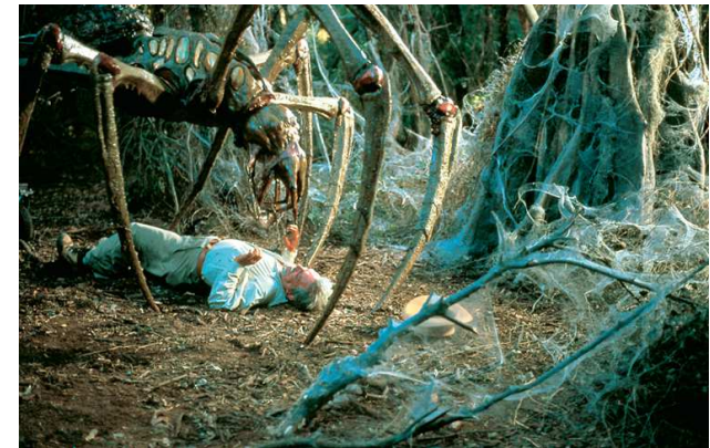
Arachnid de Jack Sholder, 2001