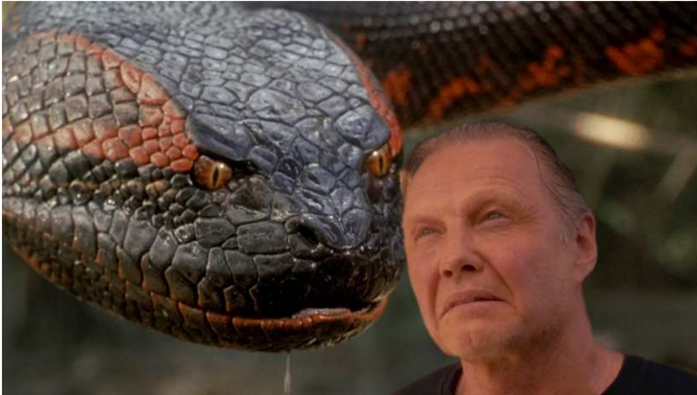
Anaconda, de Luis Llosa, 1997