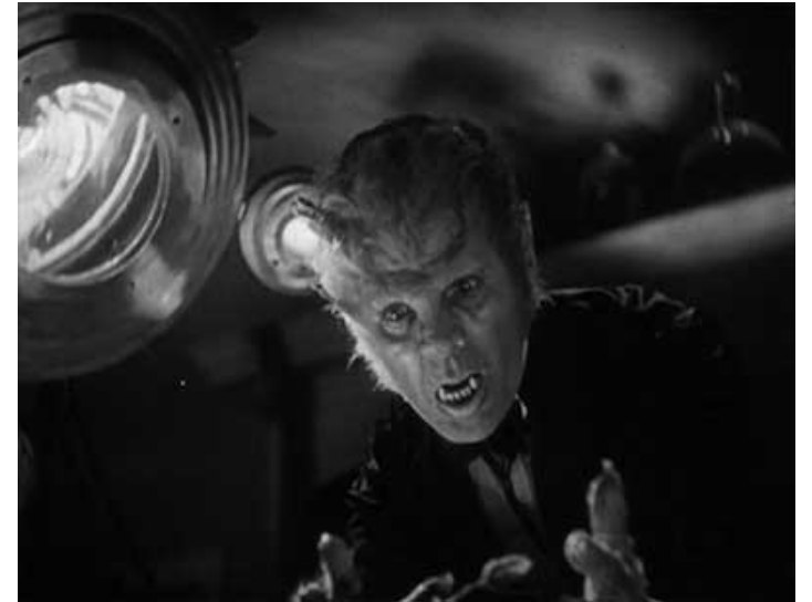
Monstre de Londres, de Stuart Walker, 1935