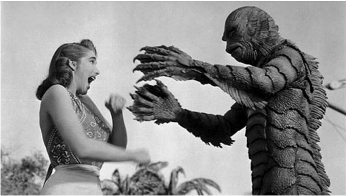
L'étrange créature du Lac noir, de Jack Arnold, 1954