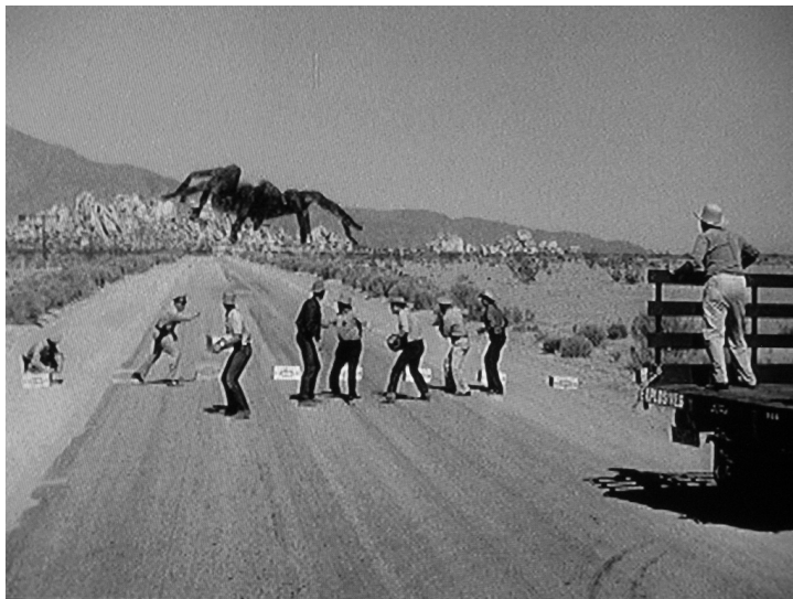
Tarantula, de Jack Arnold, 1955