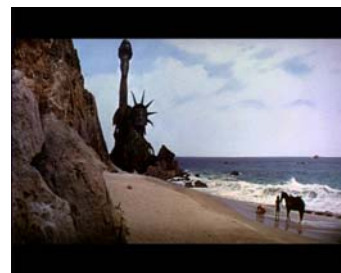
fin du film

Comment peut-on rapprocher ces deux plans ? A quel passé renvoie ce plan final ?