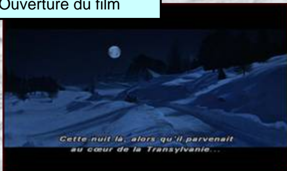
Ouverture du film