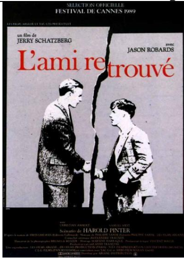
Affiche de cinéma, 1989

- Quelles informations complémentaires amènent ces affiches successives ?