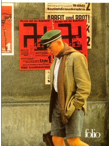
1 ère de couverture du roman de 1971, réédition

Fred Uhlman L'ami retrouvé Introduction d'Arthur Koestler