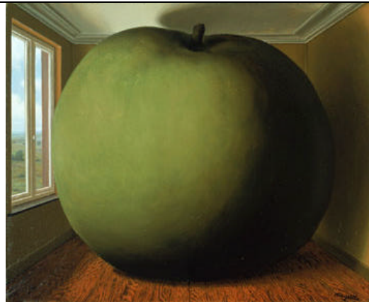
La Chambre d'écoute

Dans ce tableau, Magritte fait jouer les ressorts illusionnistes des lois de la perspective classique : pièce, pomme, fenêtre.