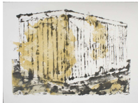
Cognée.P (œuvre de l'artothèque)

Née en Allemagne en 1906, l'idée de faire circuler les œuvres chez des particuliers moyennant cotisation se développe en Europe du Nord à partir des années 1960. En France, cette pratique s'inscrit d'abord dans le cadre des maisons de la culture. La véritable consécration des artothèques a lieu dans les années 1980.