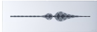
Christina Kubisch "Onde magnétique Poitiers" (sérigraphie)