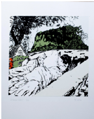
Frédéric Urto "Le baiser infini" (sérigraphie)