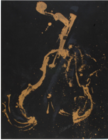
Arman (oeuvre de l'artothèque)