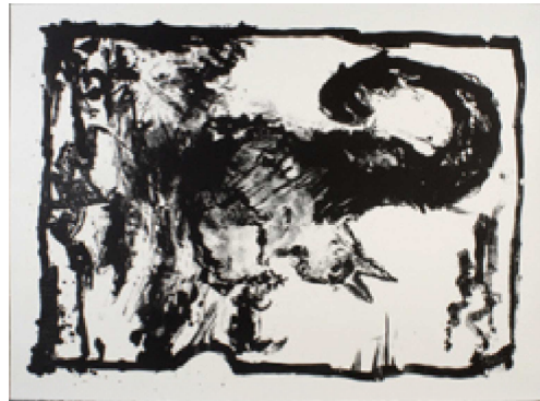
Pincemin.JP (oeuvre de l'artothèque)

Une politique d'acquisition définie par une commission regroupant différents professionnels du monde de l'art contemporain de Poitiers, permet de proposer au public un panorama de l'art des dernières décennies.