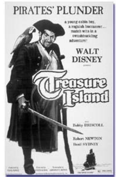
Affiche du film de 1950