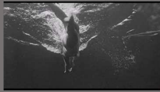
Regard subjectif du monstre