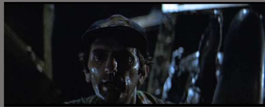
Apparition dans la profondeur de champ, à l'arrière-plan / cloisonnement du regard de la victime