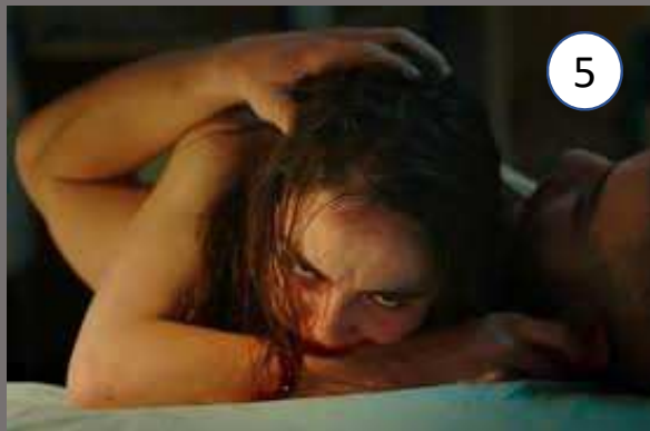
Grave , J. Ducournau, 2017