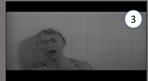
Psychose , A. Hitchcock, 1960