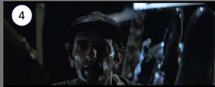
Alien , R. Scott, 1979