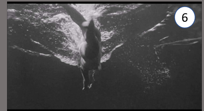
L'étrange créature du lac noir , J. Arnold, 1954