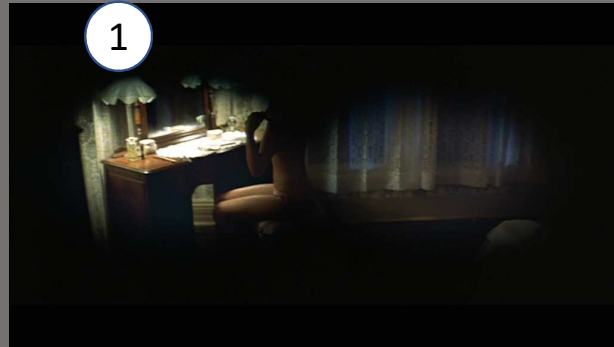
Halloween , J. Carpenter, 1978 (1, 2)

Identifiez le procédé pour susciter l'angoisse chez le spectateur