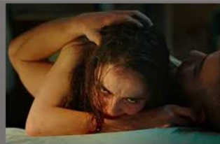
Monstration de l'acte meurtrier