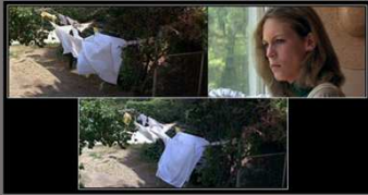
La disparition du monstre du cadre