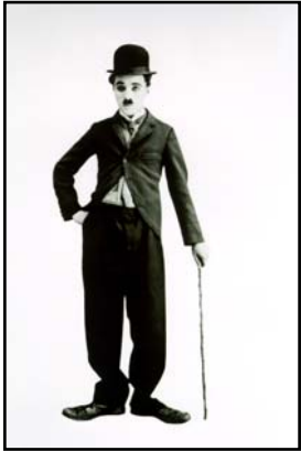
une étude de la société