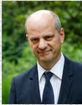
Jean-Michel Blanquer, Ministre de l'Éducation nationale