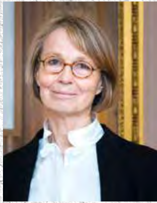
Françoise Nyssen, Ministre de la Culture