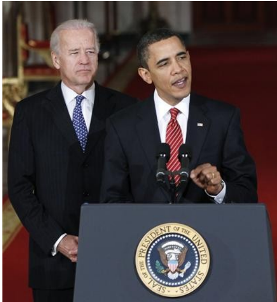
RÉFORME HISTORIQUE AUX ÉTATS-UNIS Discours de Barack Obama, aux côtés du vice-président américain Joe Biden. Photo prise le 21 mars 2010/REUTERS/Jason Reed

Bien que les Américains doutent, la réforme de santé enfin votée soulage Wall Street.