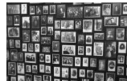
Mur de photos. Photo prise à Auschwitz

"C'est arrivé, cela peut donc arriver de nouveau : tel est le noyau de ce que nous avons à dire." Primo Levi.