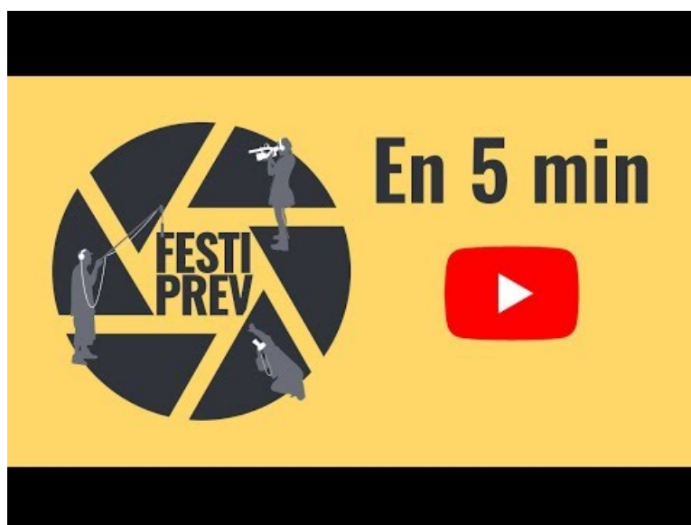
FestiPREV - 5 min pour vous dire ce que c'est (Video Youtube) Festival International du Film de Prévention et de Citoyenneté Jeunesse.