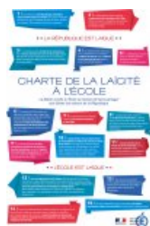
Les 15 articles de la Charte de la Laïcité à l'École. Cliquer sur la vignette

La charte présente la laïcité des personnels, des enseignements et des programmes comme la garantie pour chaque élève d'un accès libre à tous les moyens intellectuels et culturels nécessaires à la construction et à l'épanouissement de sa personnalité singulière et autonome.