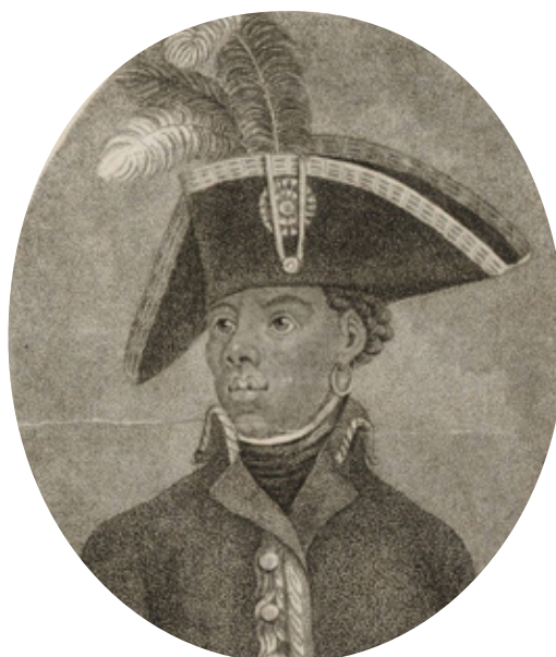
Portrait de Toussaint Louverture, par J. Sun Aujourd'hui, seuls les programmes des lycées professionnels et des lycées généraux d'outre-mer évoquent la révolution haïtienne (1791-1804).