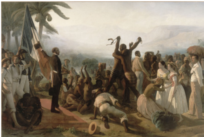
L'abolition de l'esclavage dans les colonies françaises ou proclamation de la liberté des noirs aux colonies, F.A. Biard