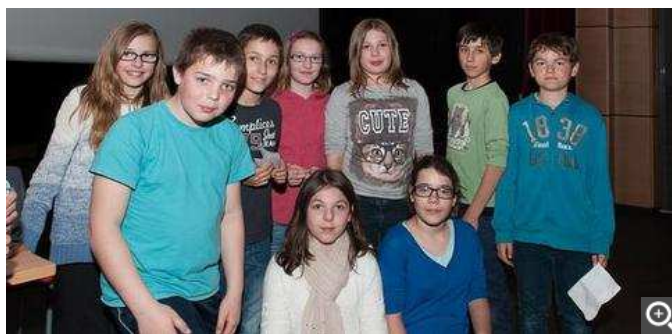
Les collégiens de Lezay ont présenté leur projet autour de la biodiversité à l'ensemble des classes participantes.