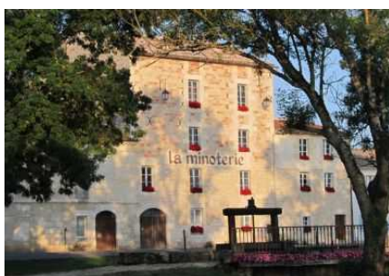
La Minoterie. Cliché : Robert Hemono