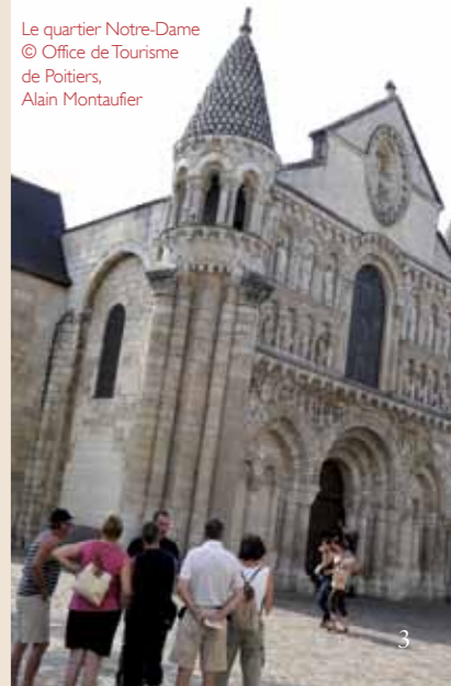
Le quartier Notre-Dame

Nathanaëlle Gervais, guide-conférencière