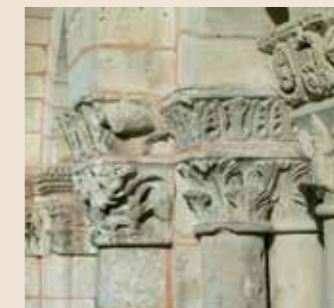
Chapiteaux, bâtiment conventuel, Saint-Benoît