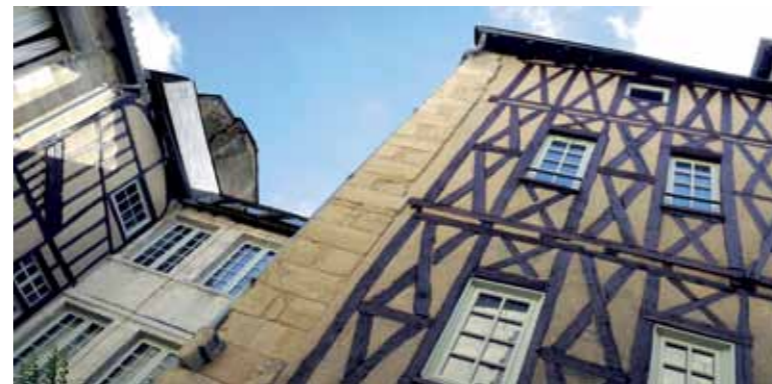
Autour de Notre-Dame-la-Grande, maisons