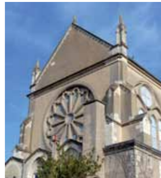
Chapelle du Gesù