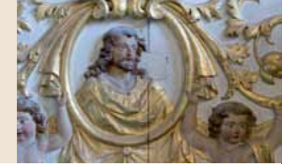
Christ, chapelle Saint-Louis du collège Henri IV