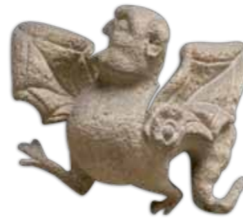
Drôle d'oiseau ! Culot, hôtel Fumé