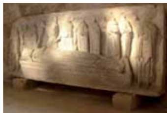
Cénotaphe, chapelle des Augustins, 12 e siècle