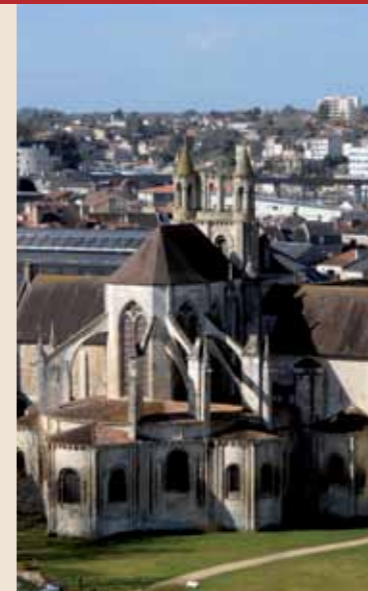
L'abbaye Saint-Jean de Montierneuf depuis le chemin des crêtes