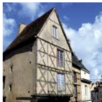
Rue des Trois-Rois, maison en pan-de-bois