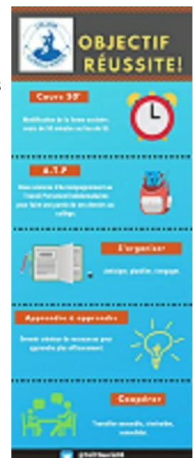
Totem Objectif Réussite