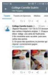
Exemple 2 de Tweet

Les conseils pédagogiques sont des moments privilégiés pour travailler ensemble sur cette action.