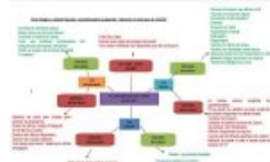
Schéma synthétique du bilan (second trimestre)