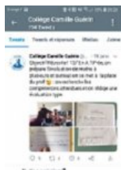
Exemple 1 de tweet

Un compte twitter 🔗 a été créé pour le collège ( @ColCGuerin86 🔗 ) pour partager et rendre compte des nouvelles pratiques.