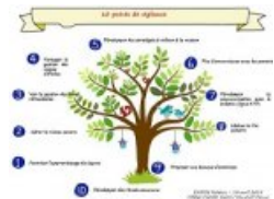
10 points sur lesquels il faudra être vigilant

Des pistes d'évolution ont été dégagées en juin pour améliorer le dispositif :