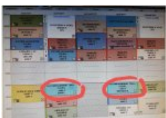
Emploi du temps

Le suivi de l'expérimentation s'appuie sur un plan de formation et des points d'étape effectués sur la base d'indicateurs choisis par l'équipe.