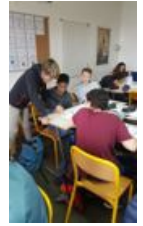
Coopération entre élèves

Pour les acquis, le dispositif a permis à certains élèves de mieux s'organiser, s'approprier des méthodes de travail et donc d'améliorer le niveau général de leurs connaissances . Les effets sur le raisonnement ne pourront être faits qu'à long terme. Ces séances ont permis aux élèves de s'épanouir davantage face aux tâches à effectuer. Ils se sont montrés plus coopératifs les uns envers les autres. Enfin les effets sur les parcours ne pourront être évalués qu'à plus long terme.