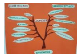
Exemple d'une charte de coopération

Les adultes présents reformulent les consignes pour aider les élèves, guident les élèves pour démarrer ou trouver les ressources pour l'aider à réussir, favorisent l' autonomie . Ce temps peut aussi permettre