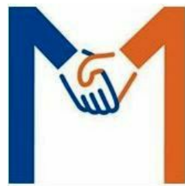
Logo MicroLycée st maixent

La vie au microlycée s'organise dans six salles :