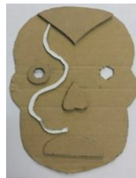
Logo H Martin Villebois

Outre la découverte d'une fête traditionnelle latino-américaine, les quatre séances de 2h consacrées au projet articulent recherches et lectures de documents variés (textes informatifs, diaporamas, chansons, références picturales et/ou iconographiques), travail en langue étrangère (compréhension et expression orale mais également compréhension et expression écrite) et travaux d'arts plastiques.